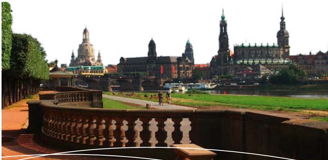
Blick auf die Altstadt von Dresden

Schon in zwei Auto-Stunden erreicht man Prag. Verwinkelte Gässchen und Bauten, gotische Kathedralen, Barock- und Renaissancepaläste haben der tschechischen Hauptstadt ihren Charme bis heute bewahrt. Der Hradschin mit der Prager Burg und die Altstadt einschließlich Karlsbrücke gehören ebenso zum Weltkulturerbe wie Josefstadt und Neustadt. Fast 500 Türme und Aussichtstürme prägen das Stadtbild. Auch die Fülle an Kunstschätzen und der Prunk der Adelspaläste sind Zeugen einer glanzvollen Zeit. Wer den Abend noch in der Stadt verbringt: Ein Spaziergang durch enge Gassen im Schein von Gaslaternen und wunderschöne Aussichten sind die geheimen Zutaten für einen romantischen Cocktail in Prag.