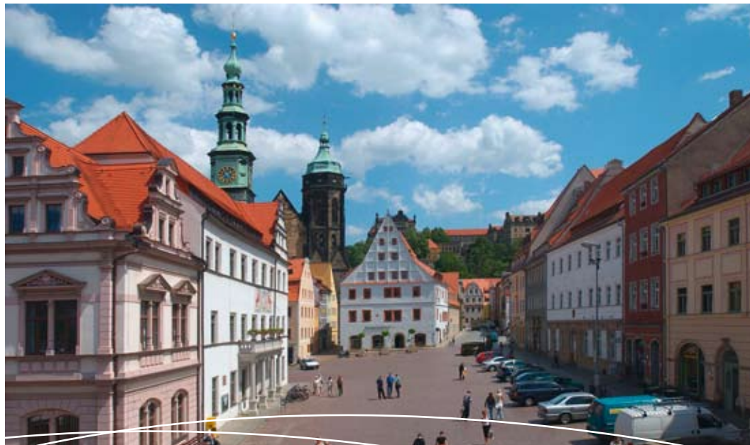
Historischer Canalettoblick Pirna