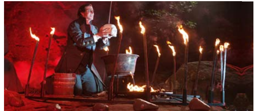
Aufführung „Der Freischütz“ auf der Felsenbühne Rathen

Sebnitz war einst die Hochburg europäischer Seidenblumenfertigung. Diese große Tradition lässt sich heute nur noch in der Schauwerkstatt im Haus „ Deutsche Kunstblume Sebnitz “ und einigen wenigen Kleinbetrieben nachvollziehen. Wer will, darf in der Werkstatt auch mal „blümeln“.