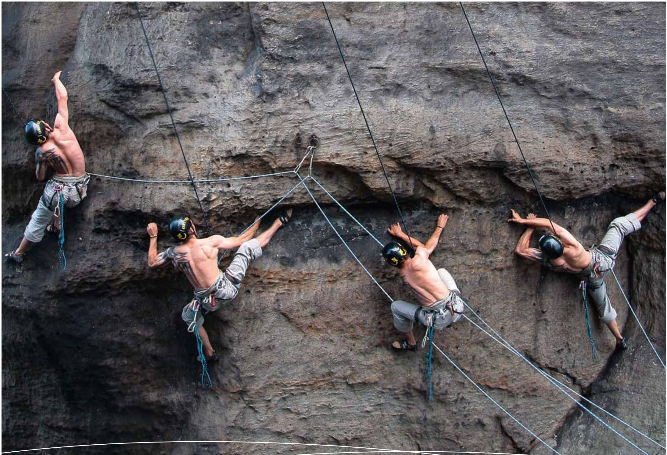
Kletterer in Zeitraffer